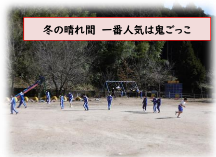
冬の晴れ間 一番人気は鬼ごっこ