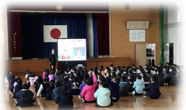
三学期始業式 三学期スタート!