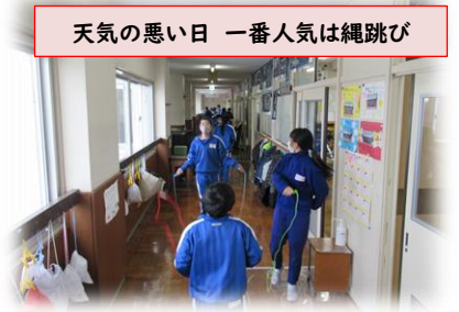
天気の悪い日 一番人気は縄跳び

先日3学期の始業式があったように感じますが、まもなく1月が終わろうとしています。