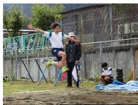
5・6年生の華麗なジャンプ!

コロナ禍の影響で昨年度、今年度と2年にわたって町陸上記録会が実施できませんでした。6年生は何も経験しないまま卒業することになってしまうため、各校ごとに記録をとって集約する方法で代替大会を行うことになり、併せて他の学年のマラソン大会代替競技も行いました。選手や応援する人の数は本来の数より少なくなりましたが、やはり応援の力は大きく、多くの子どもが自己ベストやそれに近い良い記録を出せました。高学年の躍動する姿は低学年の刺激にもなったようです。