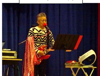
一途さんのすてきなトーク&ライブ