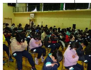
最後は自分を抱きしめて