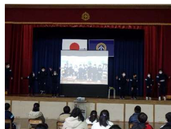
2年生 「なかよし2年生」