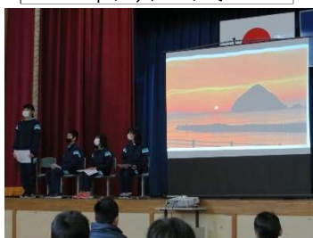
5年生 「梅の里の魅力を紹介します!」