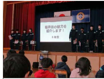
6年生 「福井県の魅力を紹介します!」