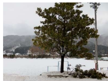
タイサンボクの枝が折れました…