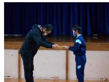
いつもありがとうございます