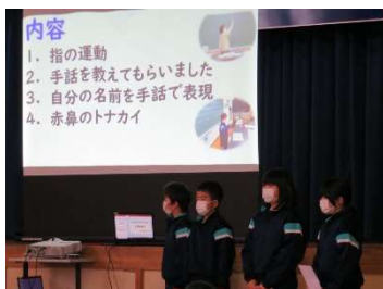
3・4年生(4年グループ) 「福祉体験学習を通して」 点字について

2/10(木)は学習発表会でした。新型コロナの感染拡大状況を考慮して残念ながら参観なしの形になってしまいましたが、子どもたちはこれまでの学習の成果をしっかりと発表し、また真剣に聞き入っていました。発表の様子についてはyoutube 限定配信でお届けします。連絡メールのアドレスからご覧ください。