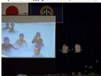
1年生「みんななかよし」 ～いいこといっぱい～