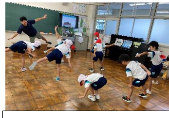
教室での体育も楽しい！！