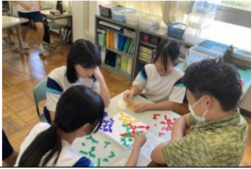
教室でボードゲーム

今年は猛暑が続いたなかでの2学期のスタートとなりました。学校では熱中症を予防するために、暑さ指数を元に体育や外遊び等ができるか判断することにしました。玄関のところに掲示してある暑さ指数を見て、子供たちは「今日は体育館が使えないから教室で遊ぼう」「体育は外でできないから体育館だな」など自分たちで判断して行動していました。