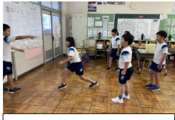
「だ〜るまさんがころんだ」