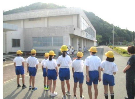
朝のあいさつ運動

ところで、みなさんはこの大事なあいさつがしっかりできていますか。学校では、朝来た時や帰る時に職員室の前で「おはようございます」や「さようなら」などとてもいい声であいさつができていますね。また、5月には6年生が、6月には5年生が玄関のところであいさつ運動を頑張ってくれました。では学校を少し出て、家の中や登下校の途中のことを思い出してみましよう。あいさつにもいろいろなレベルがありますが、家の人や地域の人、友達などに「おはよう」と言われても何も言わずに黙っているのは、一番下のレベルです。ここに書いてある「外」というのは「問題の外」という意味です。レベル1は、人から言われたらする。レベル2は自分からあいさつをする。レベル3は（自分から）明るい声であいさつをする。レベル4は（自分から明るい声で）笑顔であいさつをする。レベル5は（自分から明るい声で笑顔で）相手の顔を見てあいさつをする。そして、（自分から明るい声で笑顔で相手の顔を見て）いつでもどこでもだれにでもあいさつができれば、その人はもう立派なあいさつ名人です。みなさんは今、どのレベルになりますか？