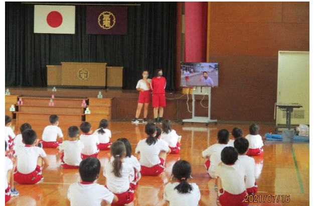
夏まつりオープニング 6年生制作のCM 上映中です!

明日からは子どもたちが待ちに待った夏休みです。夏休みは子どもたちにとって普段体験できないことにもチャレンジできる貴重な機会です。楽しく充実した夏休みにしてくれることを願っています。