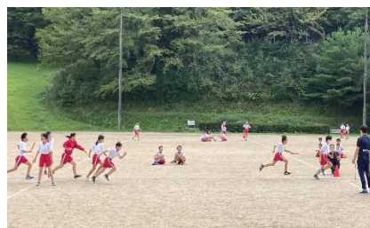
5・6年生体育「陸上チャレンジ」(校内陸上記録会)に向けて練習を頑張っています