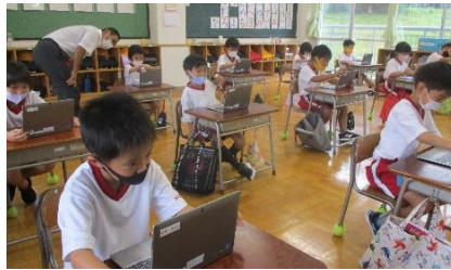
1年生 タブレットの学習ソフト を使って算数の勉強です