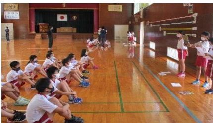
3年生 学年発表 他の学年に本の紹介をしています