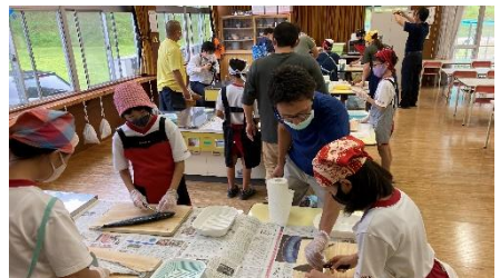
5年生 総合的な学習の時間 魚さばき体験をしました