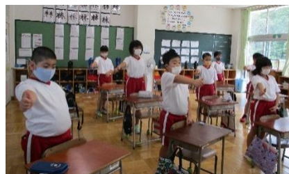
4年生 保健指導 目の体操をしています