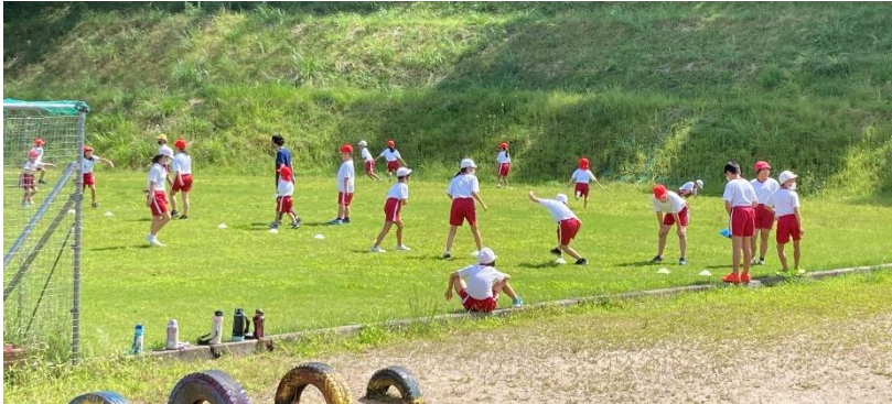
昼休みのたて割り遊び “じんとり” です

8月30日から2学期がスタートしました。おかげさまで夏季休業中は大きな事故やけがの報告などもなく、子どもたちが元気に2学期を迎えられたことを嬉しく思っております。家庭や地域の皆様、夏休み中もあたたかく見守っていただき誠にありがとうございました。スタートして3週間が経過し、秋の風が肌に心地よい季節となりました。子どもたちも学