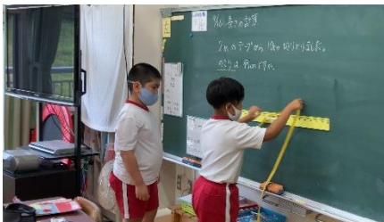
にこにこ学級 算数 長さの計算です