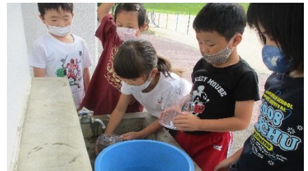
2年生 算数 水のかさははかるうの様子です