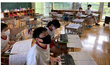
6年生 音楽 育友会の予算でキーボードを購入させていただきました。地域の皆様ありがとうございます。