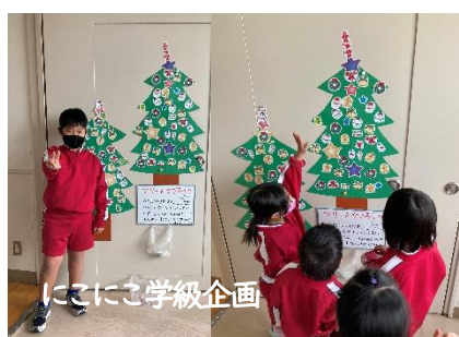
にてにご学級企画