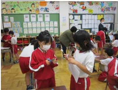
(2年生) 3年生に、おもちゃの作り方の説明をしています