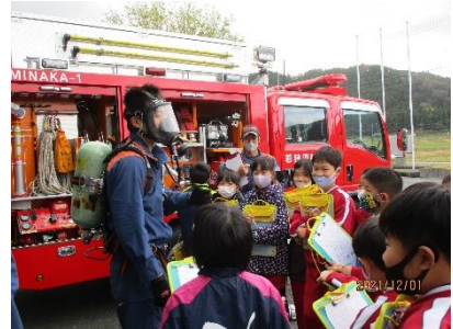
(3年生) 若狭消防署上中分署見学 放水体験もさせていただきました!

今年も多くの方にお世話になり三宅小学校地域交流会を開催し、様々なブースで楽しく交流を深めることができました。家庭・地域の方に支えられ、充実したふるさと学習をさせていただいています。地域・ふるさと学習を通して、ふるさとの良さを実感するとともに、ふるさとを誇りに思い、よりよい社会を創造しようとする気持ちを高めていってほしいと思います。