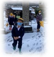
雪の中元気に登校!