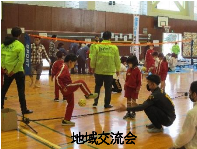
地域交流会 地域にお住いのタイ、ミャンマーの方にセパ タクロ、チンロンを教えていただきました