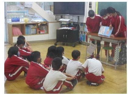
(6年生) 昼休み、たて割り班で人権に関する絵本の読み聞かせをしています

意見をつなぎ、深め合う授業づくりをテーマに取り組んでいます。授業を見ていると、自分の思いや考えを表現することを楽しんでいる様子、また、他の人の意見を聞き、「自分といっしょだ」とか「なるほど、そんな考えもあるのか」と自分と違う考えに出会うことを楽しんでいる様子も見られます。