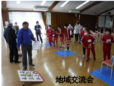
地域交流会 老人クラブの皆さんにお世話になり 輪投げを楽しみました