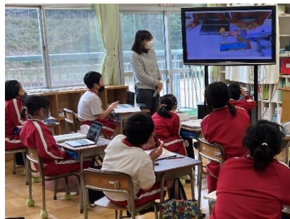
(4年生) 理科 物のあたたまり方 実験の様子をタブレットで撮影し、発表しています