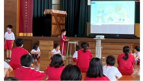
(1年生) 学年発表 全校集会で「じどうしゃずかん」と「じゅげむ」の発表をしました!

あたり一面まっ白な雪景色となりました。寒さに負けず、子どもたちは、毎日、楽しく、そして意欲的に学校生活を送っています。様々な学習や活動を通して心身ともに大きく成長することができました。家庭や地域の皆様をはじめ多くの方々のご支援、ご協力、誠にありがとうございました。12月23日から1月10日までは冬休み、健康・安全に気をつけて楽しい冬休みにしてほしいと思っています。