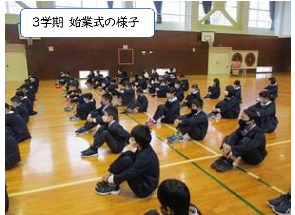
3学期 始業式の様子

新型コロナウイルスは予断を許さない状況ですが、感染防止対策を徹底し、子どもたちが安心・安全で充実した日々を送れるよう、職員一同、全力でサポートしてまいります。家庭、地域の皆様におかれましては、本年も変わらぬご支援とご協力をよろしくお願い申し上げます。