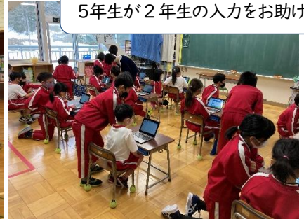
健康観察をタブレットにも入力、 5年生が2年生の入力をお助け