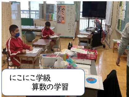
にこにこ学級 算数の学習