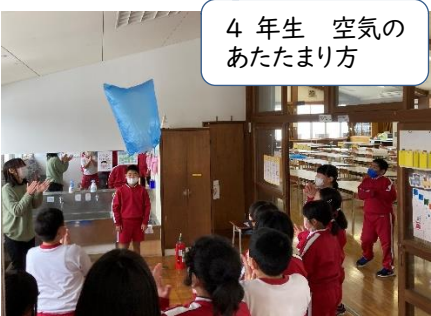
4年生 空気の あたまり方