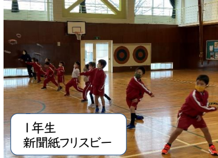
1年生 新聞紙フリスビー