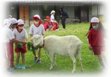
農楽舎で写生をしてきました