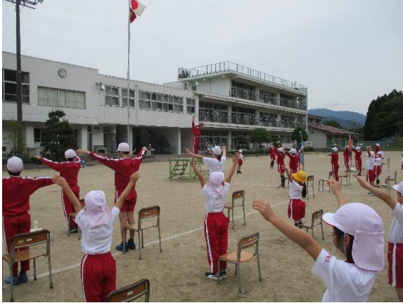
校内体育大会に向け、ラジオ体操の練習です

野山に吹く風が心地よい季節がやってきました。学校では21日に予定されている体育大会の練習の真ただ中、子どもたちは、一生懸命、そして楽しそうに競技や応援の練習を頑張っています。新型コロナはまだまだ安心できる状況ではありませんが、様々な行事等については、感染対策を徹底した上で可能な限り実施していく方針です。ただ、コロナ以前の形に戻すのではなく、子どもたちとともに、新しい形を模索し工夫しながら実施していきたいと考えています。